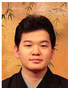
清元國恵太夫 きよもとくにえだゆう